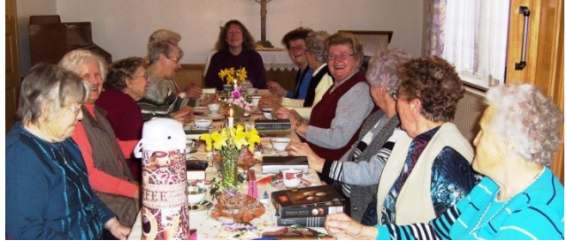
Foto: Frauenhilfe Bülstringen 1941 und 2014