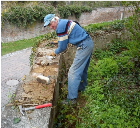
repariert die Kirchenumfriedungsmauer. Weitere Arbeiten 2014